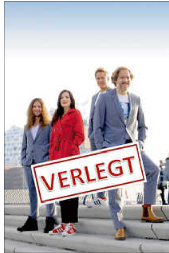
LaLeLu in Remseck am Neckar - verlegt!

Wir danken herzlich für Ihr Verständnis!