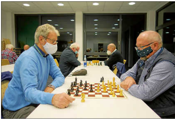
Bei einer Schachpartie entspannen