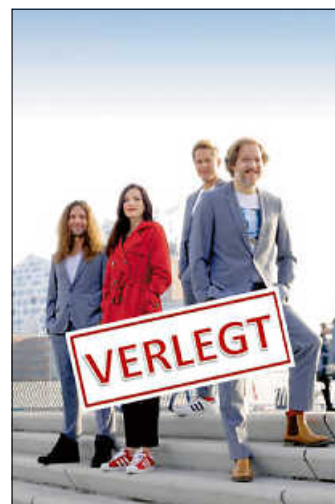
LaLeLu in Remseck am Neckar - verlegt!

Wir danken herzlich für Ihr Verständnis!