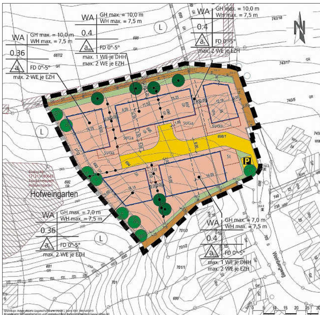
Vorentwurf Bebauungsplan vom 27.04.2021

Für den Geltungsbereich ist der Lageplan vom 27.04.2021 maßgebend. Er ergibt sich aus folgendem Kartenausschnitt: