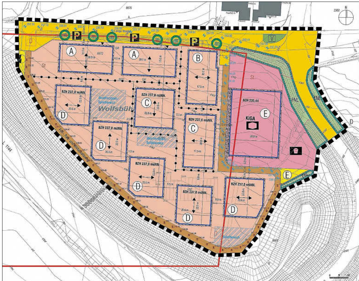
Entwurf Bebauungsplan vom 27.04.2021