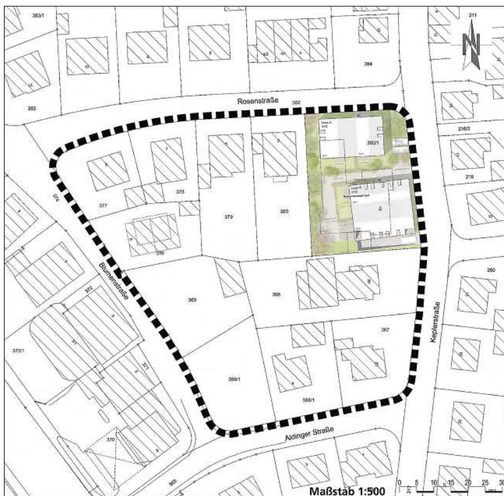
Abgrenzungsplan vom 27.04.2021

Nach Abbruch des ehemaligen Rathauses Neckargröningen steht das Gelände für eine Neubebauung zur Verfügung. Da einerseits die umgebende Bebauung hauptsächlich durch Wohnnutzung geprägt ist und andererseits in der Stadt Remseck am Neckar eine starke Nachfrage nach Wohnraum besteht, soll die Fläche des ehemaligen Rathauses insbesondere mit Geschosswohnungsbau vorgesehen werden. Eine kleine, in den Geschosswohnungsbau integrierte Gewerbeeinheit in Form von Büroräumen ist ebenso vorstellbar. Für die Realisierung ist eine gute soziale Durchmischung gewünscht. Der Anteil des sozialen Wohnungsbaus wird 20% betragen. Somit kann dem steigenden Druck auf dem Wohnungsmarkt entgegengewirkt werden.