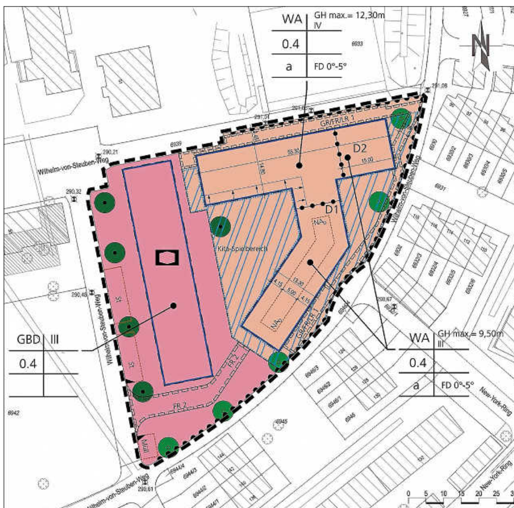
Entwurf Bebauungsplan vom 27.04.2021