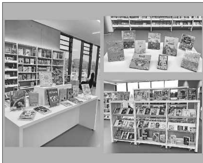
Collage: Mediathek im KUBUS