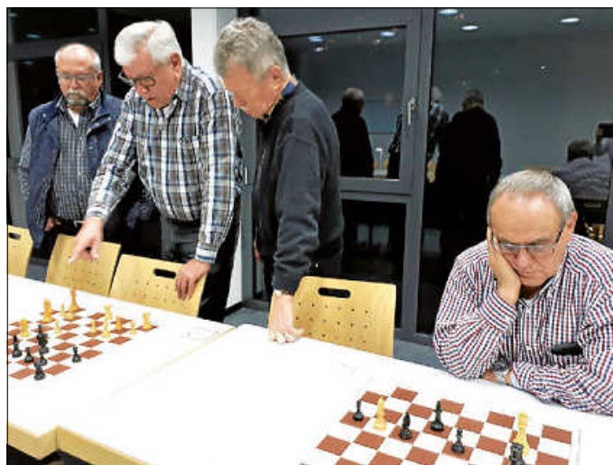
Bald werden wieder Schachrätsel gelöst