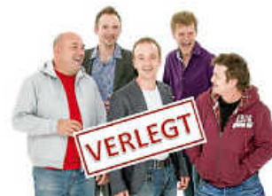
fünf - erneut verlegt

Die Veranstaltung "fünf singen Kriwanek" vom ursprünglich 12. März 2021 wurde nach Rücksprache mit der Künstleragentur nochmals verschoben. Die Veranstaltung wird von Freitag, 25. Juni 2021 auf Freitag, den 30. Juli 2021 verlegt. Uhrzeit und Veranstaltungsort bleiben unverändert. Die Tickets behalten ihre Gültigkeit.