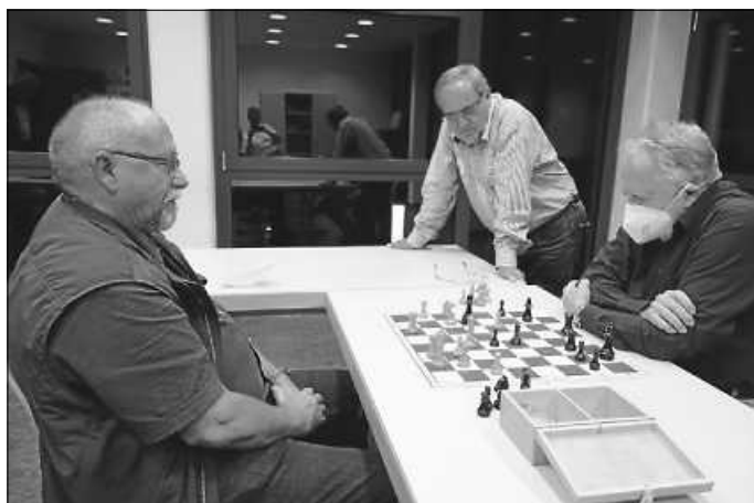
Ein kurzer Blick in eine andere Partie