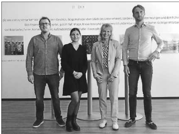
Nach der Vertragsunterzeichnung