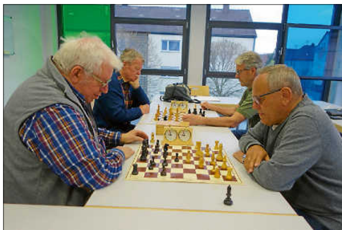
Kleines Blitzturnier am Schachabend