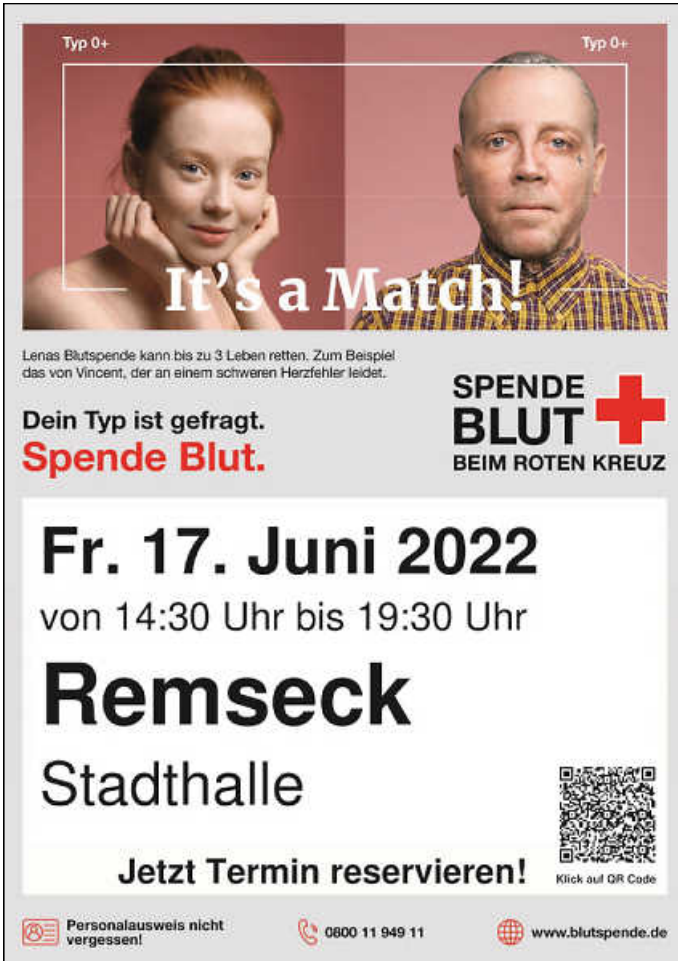
Plakat: DRK Blutspendedienst