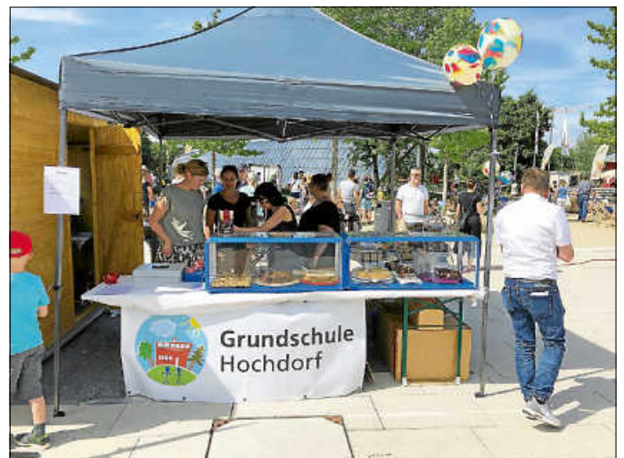
Pavillon auf dem Marktplatzzfest