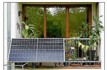
Solaranlage am Balkon speist über Stecker in Wohnungsstromnetz ein

Möglich ist dies mit Stecker-Solargeräten, auch Balkonmodule oder Mini-Solaranlagen genannt. Im Gegensatz zu den herkömmlichen Dach-Solaranlagen können diese selbst am Balkon montiert oder im Garten oder auf der Terrasse aufgestellt werden. Über eine reguläre Steckdose können die Stecker-Solargeräte in das Wohnungsstromnetz einspeisen und die dort angeschlossenen Geräte mit Strom versorgen. Reicht der Strom vom