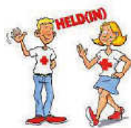
Grafik: JRK Remseck

Wir freuen uns auf euch und beantworten gerne eure Fragen!