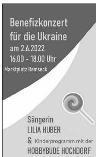
Benefizkonzert für die Ukraine

Am 2. Juni findet das Benefiz-Konzert von Lilia Huber statt. Wir begleiten dieses mit unserem Kinderprogramm, so dass es für Groß und Klein ein toller Nachmittag wird. Wir freuen uns auf Euch! Euer Team der Hobbybude Hochdorf