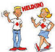
Grafik: JRK Remseck