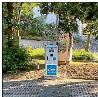
Ladesäule in der Bittenfelder Straße

Seit einigen Tagen sind die E-Ladesäulen in der Straße Am Remsufer im Stadtteil Neckarrems, in der Wasenstraße in Neckargröningen sowie in der Bittenfelder Straße im Stadtteil Hochdorf installiert. Die E-Ladesäule in der Waldallee in Hochberg wird bis Ende Juni 2022 installiert.