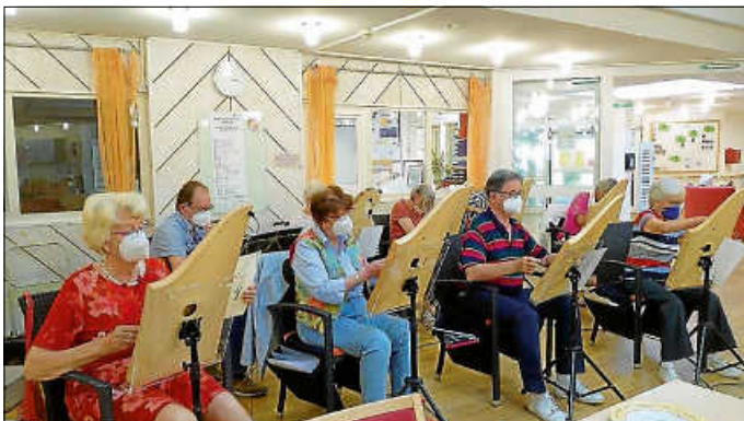
Einen musikalischen Nachmittag gestaltete die Tischharfengruppe aus Möglingen den Kleeblattbewohner*innen.