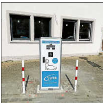
Ladesäule am Remsufer