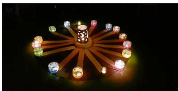
Das Licht in der Laterne

Um kurz vor fünf am Nachmittag des 11. Novembers 2022 fanden sich die Kinder der Kita St. Martin gemeinsam mit ihren Eltern, Verwandten, Bekannten und den Erzieher/Innen der Kita vor der Katholischen Kirche St. Petrus Canisius ein. Es sollte St. Martin gefeiert werden. Das erste Mal seit langer Pandemie-Pause.