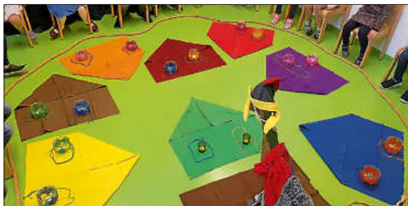
Kinder erleben St. Martin mit allen Sinnen