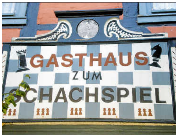
In Ströbeck gibt es viele Hinweise auf das Schachspiel