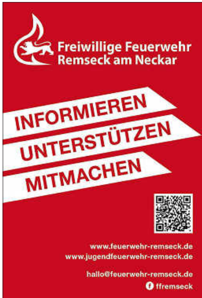
Plakat: Feuerwehr Remseck