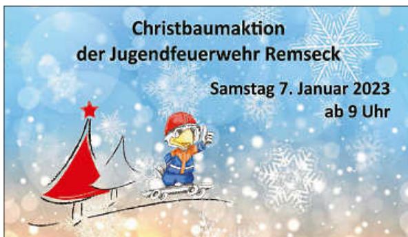
Plakat: Feuerwehr Remseck