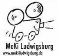
Grafik: MoKi Ludwigsburg

Insgesamt 19 Remsecker Teams sind aktuell gemeldet und freuen sich auf zahlreiche weitere Mitradelnde... sind Sie schon dabei?