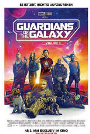
Plakat: Marvel Studios