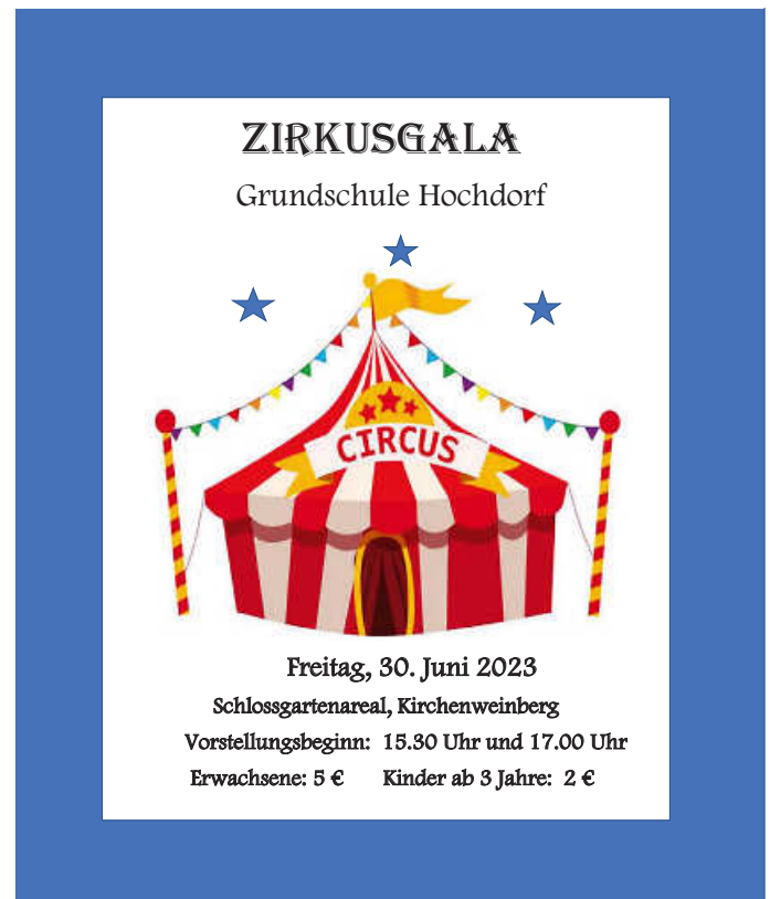
Plakat: Grundschule Hochdorf