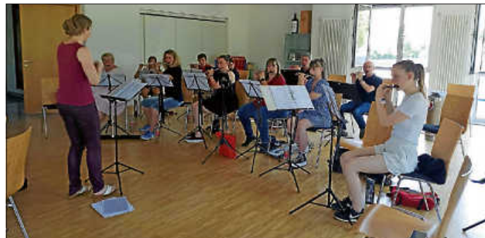
Das Flötenregister bei der Probe

Am vergangenen Sonntag fand unser erster Konzertprobenstag statt. Wir bedanken uns bei allen Musikern für die tolle und erfolgreiche Probe. Sowohl am Vormittag, als fleißig an verschiedenen Stücken in den einzelnen Registern geübt wurde. Und ebenso für die gemeinsame Probe aller Register, die nach einer Stärkung am Mittag stattfand.