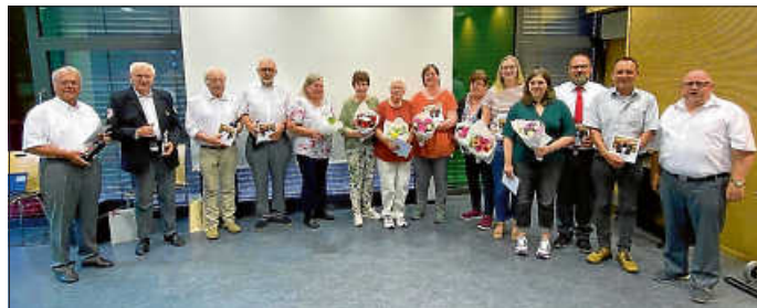
Die Geehrten für langjährige Mitgliedschaft und Verabschiedung der Funktionsträger