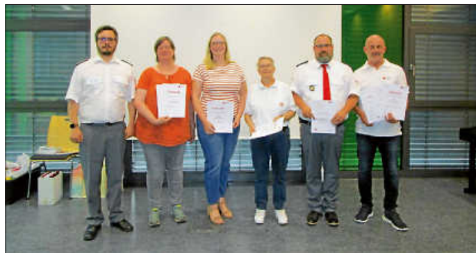
Die Geehrten im Rahmen der Covid-19-Pandemie