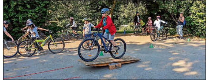
an der Wippe