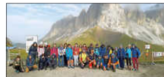
Remsecker Schüler in den Dolomiten

Hinweis: Die männliche Form (generisches Maskulinum) wird wegen der besseren Lesbarkeit verwendet. Im Sinne der Gleichbehandlung steht es für alle Geschlechter. Die verkürzte Sprachform hat redaktionelle Gründe und ist wertfrei.