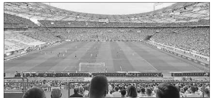
VfB Stuttgart gegen VfL Bochum am 19.08.2023