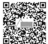
QR-Code: Jugendreferat Remseck