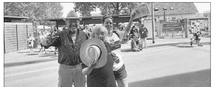
Bewohner und Mitarbeiter vor dem Stadion