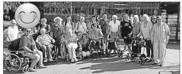
Bewohner und Mitarbeiter vom Haus Kastanienblüte vor der Wilhelma

Am 19.08.2023 waren jeweils zwei Bewohner und Mitarbeiter vom Haus Kastanienblüte beim VfB Stuttgart in der MHP Arena. Gespannt konnte das Spiel VfB Stuttgart vs. VfL Bochum bei kühlen Getränken und leckeren Speisen verfolgt werden. Die Stimmung im Stadion war unglaublich und bleibt unvergessen! Vor allem den Sieg 5:0 für den VfB haben alle gefeiert!