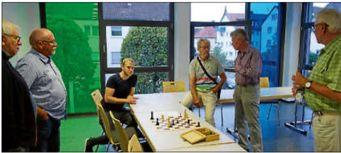
Das Turmopfer zur Mattkombination wurde schnell gefunden.

Etwas länger warten muss man anschließend, nämlich drei Wochen. Da der Oktober fünf Montage hat, kommt die Schachgruppe im November erst am 6.11. wieder zusammen. Der erste Montag im Monat ist bekanntlich der routinemäßige Schachtag.