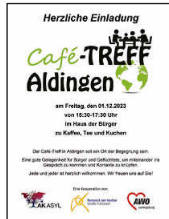
Plakat: AK Asyl