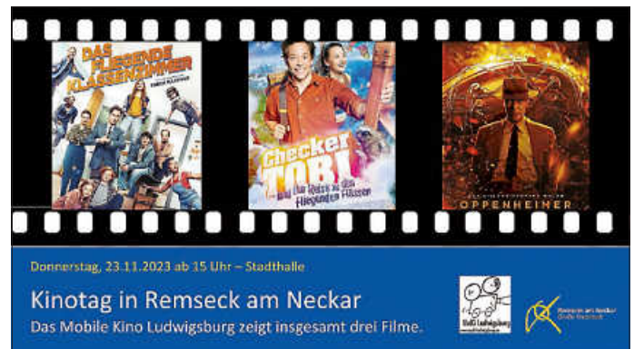
Plakat: Stadt Remseck am Neckar; MoKi Ludwigsburg

Es findet ein Getränke- und Popcorn-Verkauf durch das MoKi statt.