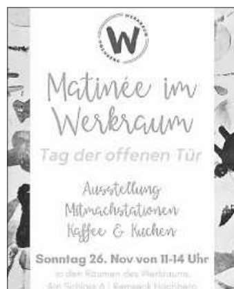
QR-Code: Dörte Luedecke