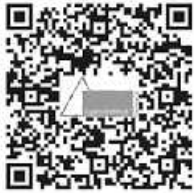
QR-Code: Jugendreferat Remseck