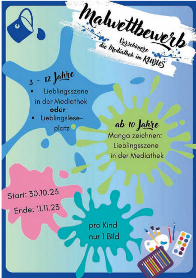
Plakat: Mediathek im KUBUS

Alle Bilder, die bis zum Samstag, 11.11.2023 in der Mediathek im KUBUS abgegeben werden, werden von Montag, 13.11.2023 bis Samstag, 25.11.2023 zum Bewerten in der Mediathek im KUBUS anonym aufgehängt. Bewerten dürfen alle Besucherinnen und Besucher, die vorbeikommen und sich an der Theke einen Bewertungskleber abholen. Die Bilder mit der höchsten Bewertung erhalten einen kleinen Preis. Alle Bilder werden im Anschluss im Kinder- oder Jugendbereich dauerhaft aufgehängt und verschönern somit unsere Mediathek. Wir freuen uns auf zahlreiche schöne, ausgefallene Gemälde von euch.