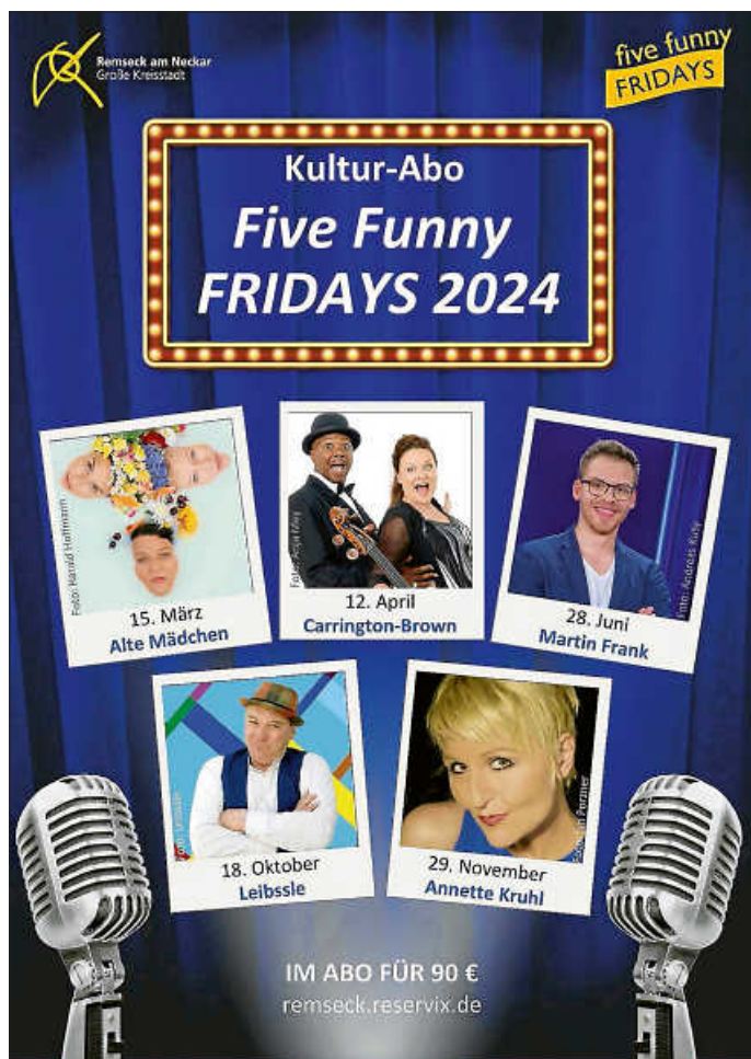
Plakat: Stadtverwaltung Remseck am Neckar

Five Funny Fridays – das bedeutet Lachen im Abo. Fünf Veranstaltungen für 90 Euro / erm. 85 Euro – Eine schöne Geschenkidee auch zu Weihnachten!