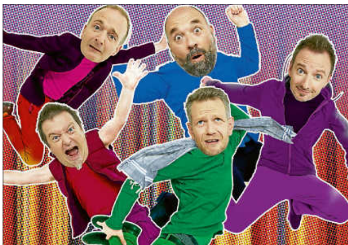
fünf - ENDLICH!

Alle weiteren Informationen zur Veranstaltung und unserem Ticketservice finden Sie unter www.remseck.de/kulturprogramm .