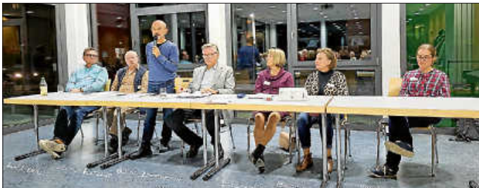
Alle Mitglieder des Vorstands

Herzlichen Dank an alle, die zu dieser gelungenen Veranstaltung beigetragen haben: Reparateure, Näherinnen, Kolleginnen am Empfang und in der Küche und alle, die mit Mittagessen und Kuchen zum leiblichen Wohl beigetragen haben.