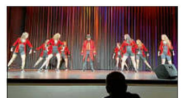
Fitness und Tanzwerkstatt, Young School Dance