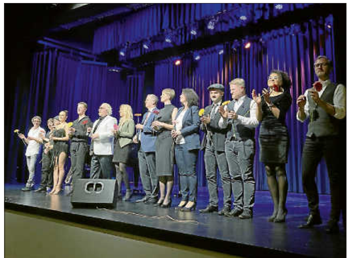
Das große Finale