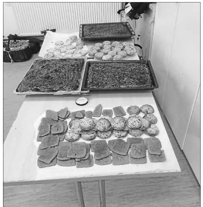
Die leckeren Ergebnisse