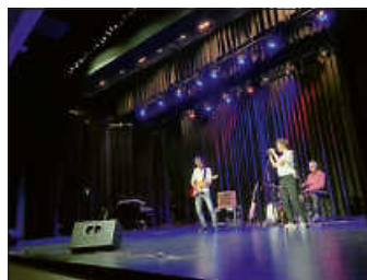
IN GROOVE School of Music