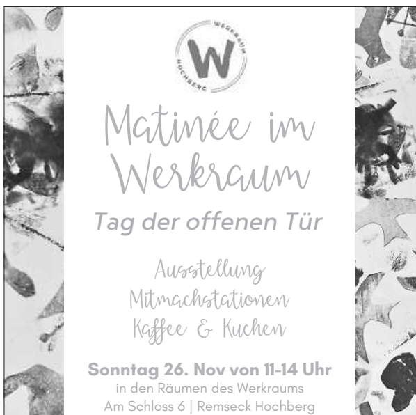
Plakat: Dörte Luedecke

Das wird ne tolle Sache, kommt und macht mit!