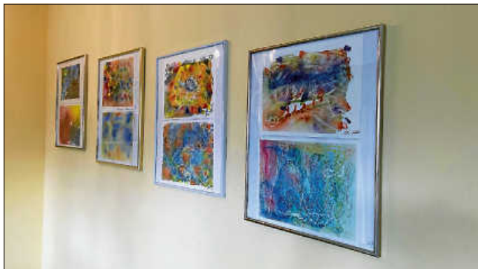
Aquarelle unserer Bewohner