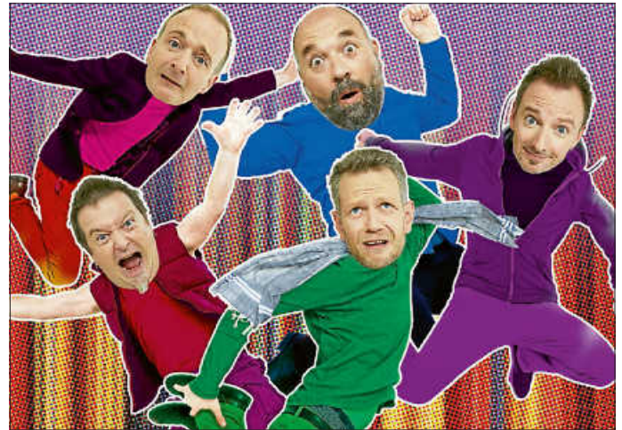
füenf - ENDLICH!

Alle weiteren Informationen zur Veranstaltung und unserem Ticketservice finden Sie unter www.remseck.de/kulturprogramm .