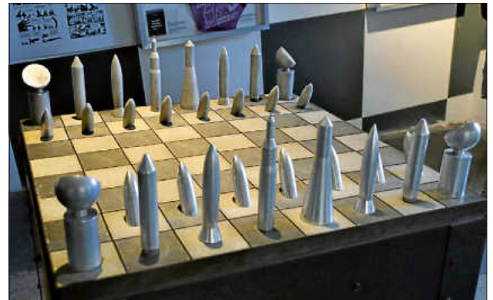
Mit diesem Schachspiel geht es raketenmäßig ab

Der nächste Schachabend startet am Montag, 20. November um 19 Uhr im Haus der Bürger in Aldingen.